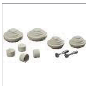
Заглушки, сальники, шурупы